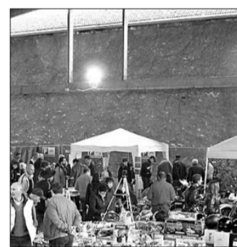
Die Motorissima in Trient ist eine Fundgrube für Motorenliebhaber.

Die Motorissima ist am heutigen Samstag von 9 bis 19 Uhr geöffnet, am Sonntag von 9 bis 18 Uhr. Infos unter www.„Motorissima“. org