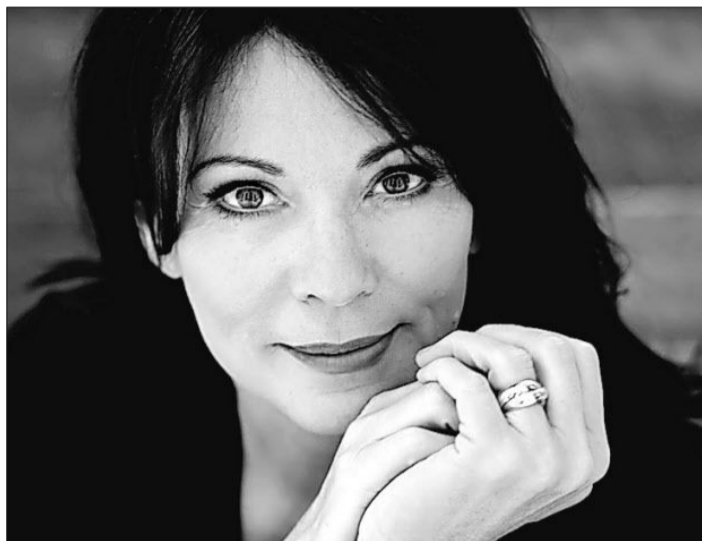
Schauspielerin Iris Berben liest Texte verfemter Autoren. Kulturinstitut

„Das war ein Vorspiel nur, dort wo man Bücher verbrennt, verbrennt man am Ende auch Menschen.“ Der 1856 verstorbene Heinrich Heine scheint in visionärer Weise die Gräueltaten der NS-Zeit vorausgesehen zu haben. Schon 1933 fanden in deutschen Städten in einer „Aktion wider den undeutschen Geist“ Bücher-