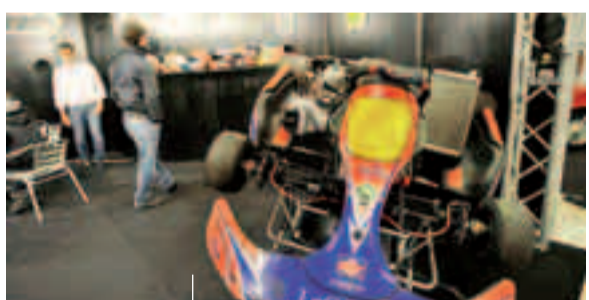
Vetture e moto in rassegna a Trento Fiere con vari stand sulla sicurezza e corsi di guida

domenica Una rassegna interamente dedicata al mondo del motore: torna sabato e domenica a Trento l'appuntamento con Motorissima, una manifestazione che quest'anno viene ospitata nei padiglioni di Trento Fiere in via Briamasco. Una 19ª edizione dove saranno esposte le ultime novità della produzione nazionale ed internazionale e non mancheranno gli spazi dedicati alle vetture, alle moto ed a tutti i bolidi a due e quattro ruote. In fiera di sarà anche l'Esercito Italiano e la Polizia Municipale con stand dedicati alla sicurezza, il Moto Club Pippo Zanini con moto e bici elettriche e ci sarà anche la scuderia «Pintarally Moto-