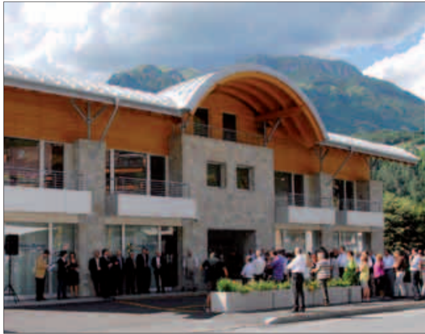
La «Cassa rurale don Guetti» di Ponte Arche. Nel suo nome nuova banca sociale in val di Non