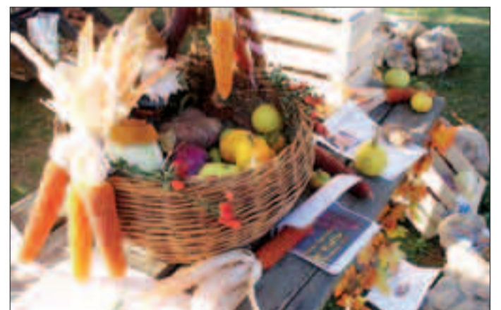
Scorcio di uno stand della decima edizione della «Festa della patata»

extravergine d'oliva». Al tutto si aggiungono animazione, musica, spettacolo; ed il grande lavoro delle cucine (sfornati oltre 1.600 pasti), oltre che degli stand di confezionamento di caldarroste, patatine fritte, strauben e quant'altro. Una decima edizione di successo, quindi, coincidente tra l'altro con il centesimo anniversario della «patata Majestic», la reginetta della festa. G.S.